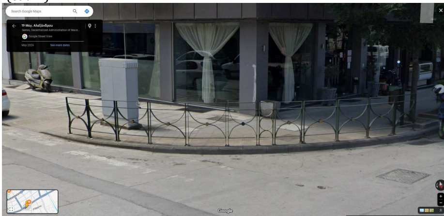
Εικ.3 (Αντίστοιχο κιγκλιδίωμα επί της συμβολής των οδών Μεγ. Αλεξάνδρου-Παπασινοδινού).

Το αρμόδιο τμήμα της Διεύθυνσης Τεχνικών Υπηρεσιών έχει μελετήσει για λόγους ομοιομορφίας έναν τύπο κιγκλιδωμάτων με τον αντίστοιχο χρωματισμό και διαστάσεις σύμφωνα με το επισυναπτόμενο σχέδιο (εικ. 2), το οποίο είναι χαρακτηριστικό της πόλης μας (εικ.3), προκειμένου να λάβετε γνώση. Το κιγκλιδίωμα τοποθετείται επί του πεζοδρομίου σε απόσταση τουλάχιστον 15cm από την άκρη του κρασπέδου), θα έχει συνολικό μήκος διαδοχικών τμημάτων κιγκλιδώματος 20μ. περίπου, καλύπτοντας τον χώρο μεταξύ των 2 διαβάσεων πεζών, επί της οδού Μεραρχίας & επί της οδού Σπετσών (εικ. 1).