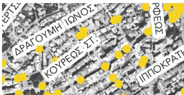
Εικόνα 6: Ατυχήματα 2016 (ΣΒΑΚ, 2020)

Η κυκλοφορία στην οδό Κωνσταντινούπολεως γίνεται σε μία λωρίδα με κατεύθυνση από δυτικά προς ανατολικά. Στην οδό Γ. Ζλάτκου η κυκλοφορία γίνεται σε μία λωρίδα με κατεύθυνση από νότο σε βορά. Στην διασταύρωση καταγράφονται ατυχήματα (Εικόνα 6). Από την οδό δεν διέρχεται αστική συγκοινωνία.