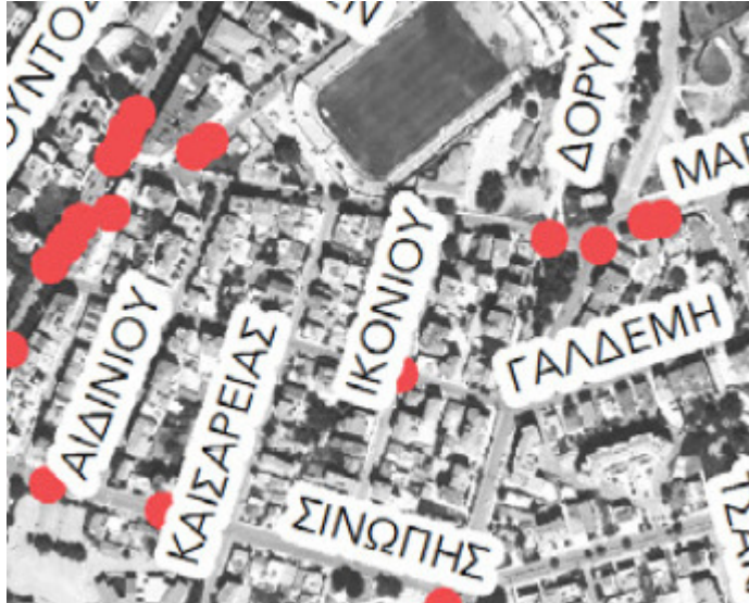
Εικόνα 3: Ατυχήματα, 2015 (ΣΒΑΚ 2020)

Σύμφωνα με την λειτουργική ιεράρχηση (Εικόνα 1) η οδός κατατάσσεται στις δευτερεύουσες συλλεκτήριες οδούς. Εξυπηρετεί τόσο την διαμπερή κυκλοφορία και την σύνδεση μεταξύ της δευτερεύουσας συλλεκτήριας οδού Δορυλαιίου και της οδού Μεραρχίας που είναι κύρια αρτηρία. Η κυκλοφορία των οχημάτων στην γίνεται σε μία λωρίδα ανά κατεύθυνση. Το συνολικό πλάτος του ενεργού οδοστρώματος δεν ξεπερνά τα 3,6 μέτρα. Από την οδό δεν διέρχεται αστική συγκοινωνία. Στην οδό καταγράφονται ατυχήματα ειδικότερα στην διασταύρωση με την οδό μεραρχίας και την οδό Καισαρείας (Εικόνες 3,4,5)