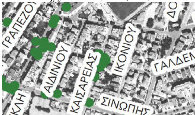
Εικόνα 5: Ατυχήματα 2017 (ΣΒΑΚ, 2020)