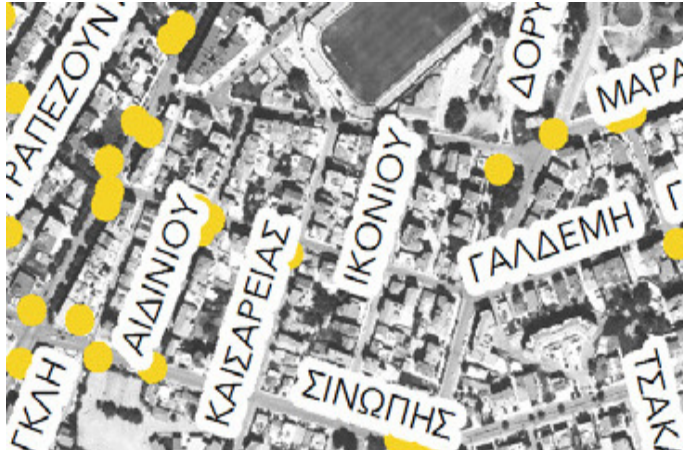
Εικόνα 4: Ατυχήματα 2016 (ΣΒΑΚ, 2020)